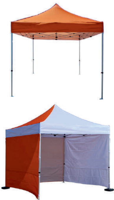
Tente publicitaire 3x3m